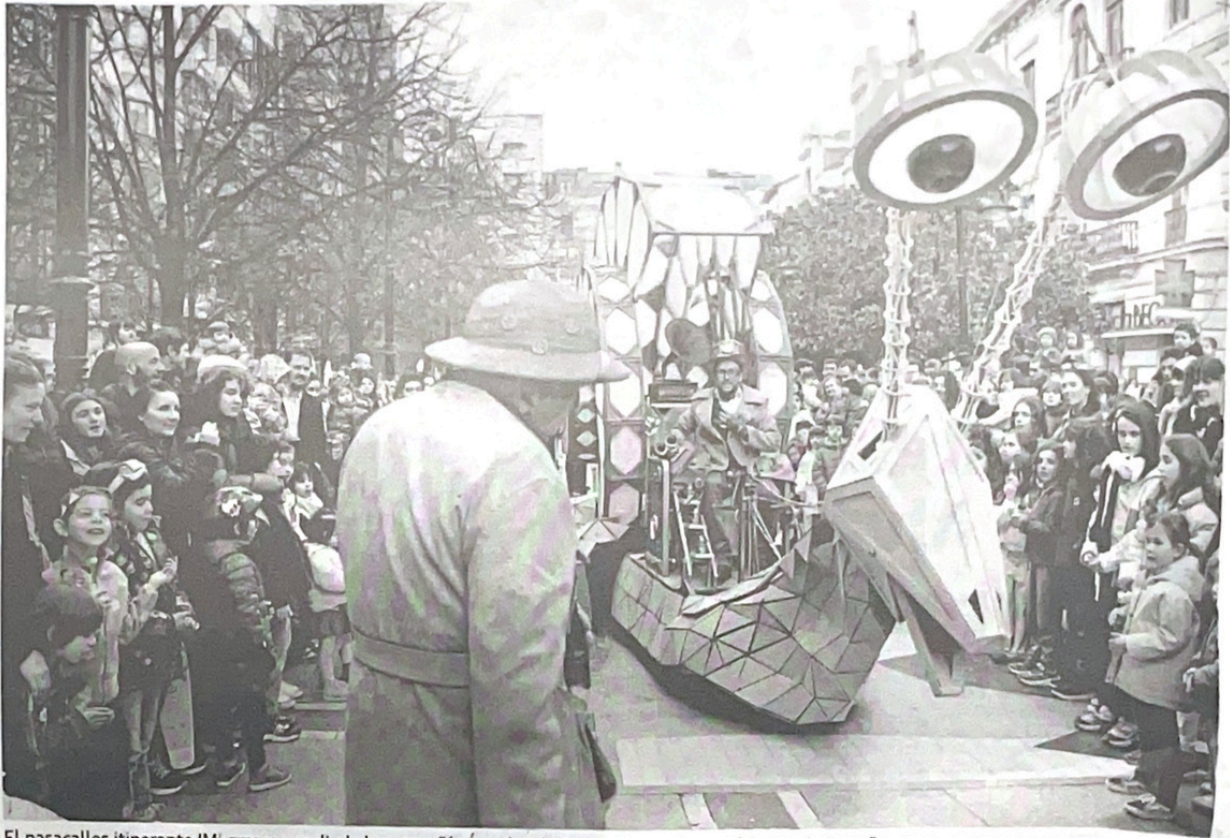
El pasacalles itinerante 'Mi gran caracol', de la compañía Ángeles de Trapo, atravesó ayer el Paseo de Begoña.

Es, pues, la selección un trabajo fundamental en el Departamen-