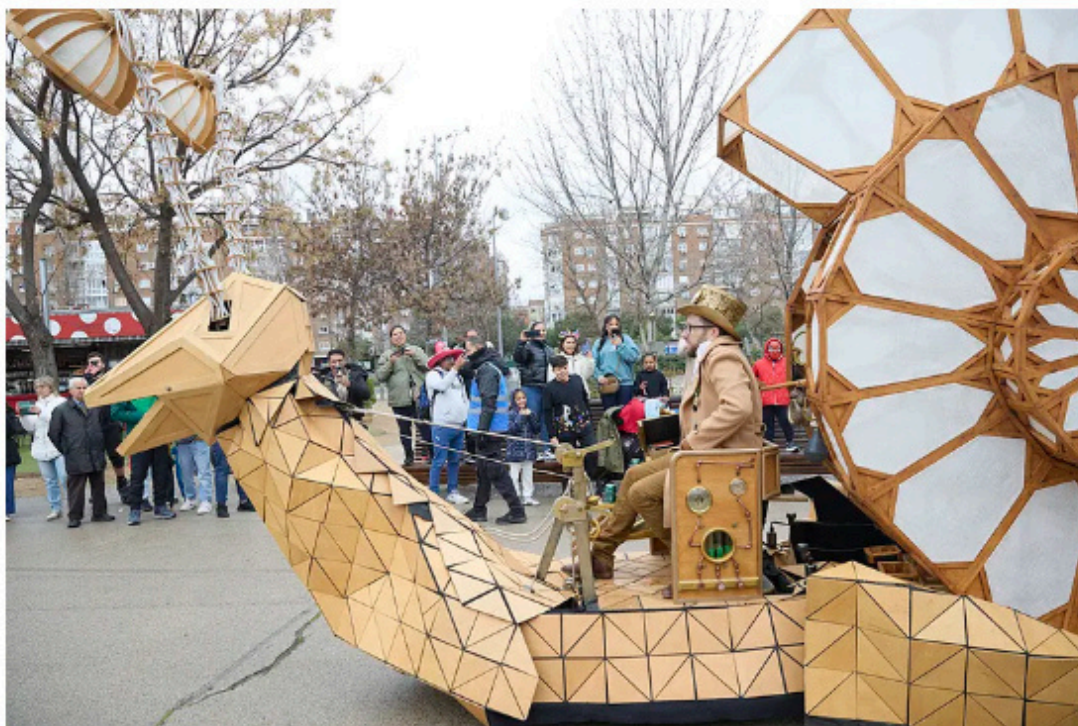
El desfile del Carnaval 2025 recorre Madrid Río. JESÚS HELLÍN