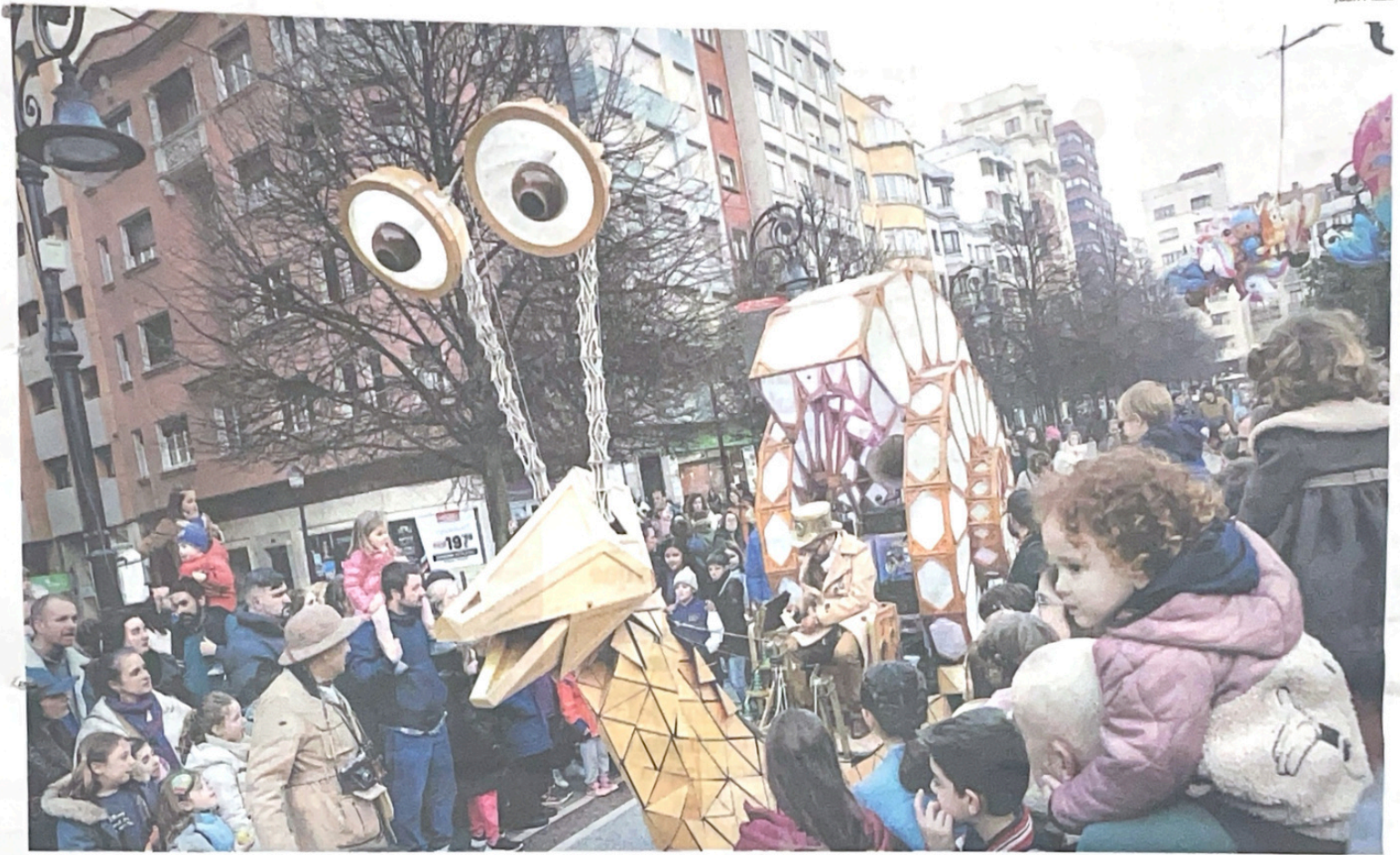
La compañía «Ángeles de trapo», con su representación de «Mi gran coronel», en el paseo de Begoña.

Un gran caracol, de tres metros de altura y ocho de largo, construido sobre madera, avanza a media tarde por el paseo de Begoña. Avanza rodeado de niños y padres, expectantes, bailones y entusiasmados; la música, los efectos de luces ayudan a amplificar el aroma familiar que se respira en este espacio del centro de Gijón y que anuncia, para algún que otro paseante despistado, que ya está en marcha Feten. Con pase lento, pero seguro, como este gigante molusco, echó a andar la Feria de Artes Escénicas para Niños y Niñas. Lo hizo con la tradicional preferia, con cuatro actos repartidos por la ciudad, antes de que hoy oficialmente ruede el certamen, en su 34.ª edición, que promete volver a ser una gran fiesta.