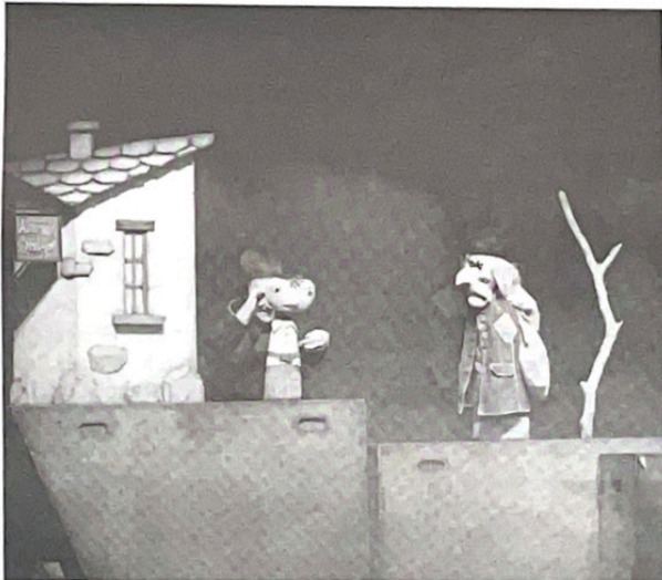
Una escena de 'La isla del tesoro', de Panduro Producciones. J. M. PARDO