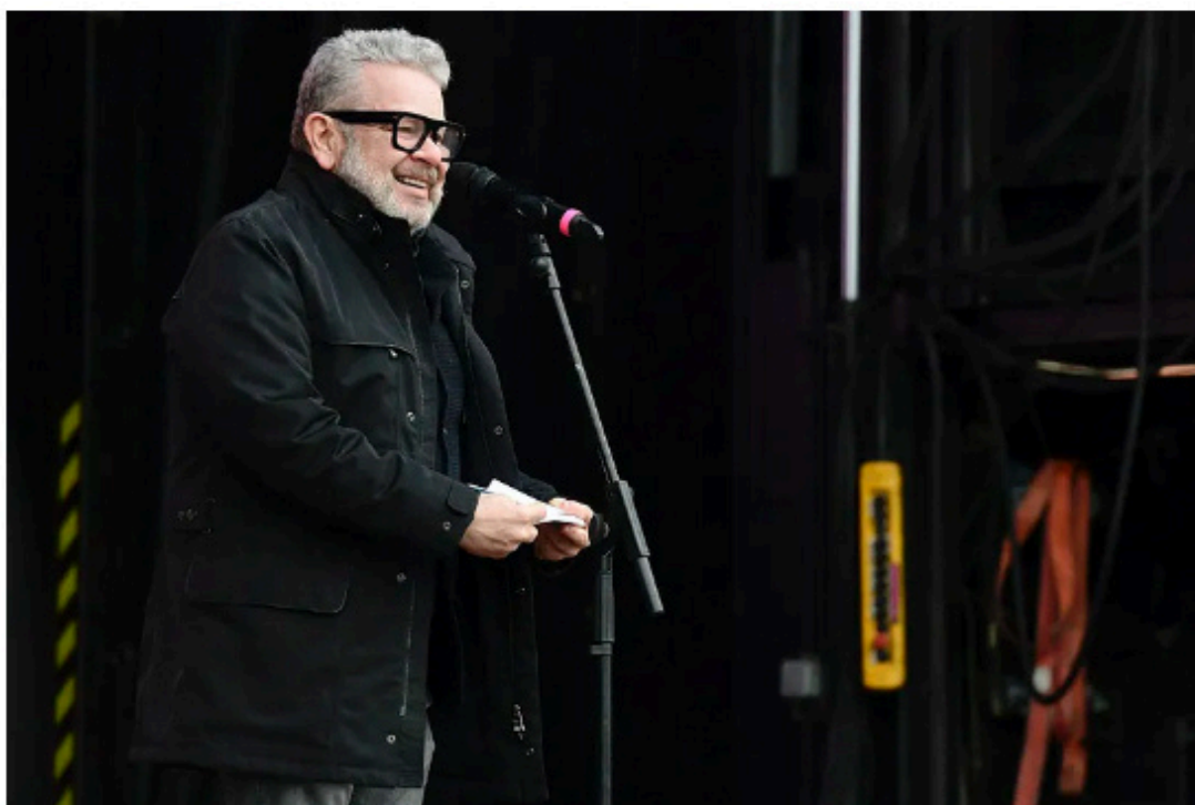
Alberto Chicote en su pregón de carnaval, este sábado, en Matadero Madrid. VÍCTOR LERENA

El televisivo madrileño da inicio a la fiesta con su pregón, aunque sin disfraz, como previa al desfile de títeres gigantes y compañías circenses que recorrió Madrid Río